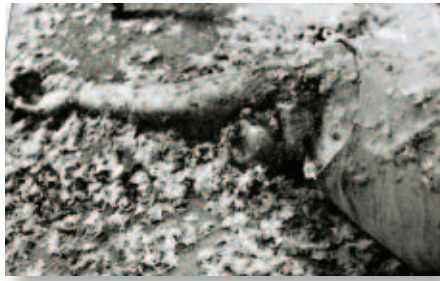
Le 26 juillet 1941. Un atroce aperçu de la scène de crime.

sa chambre au 2 e étage alors que Marx Dormoy terminait son dîner en compagnie de sa sœur dans la salle à manger. Puis, elle a quitté l'hôtel vers 21h30 prétextant vouloir prendre le train de 22h28 pour Lyon.