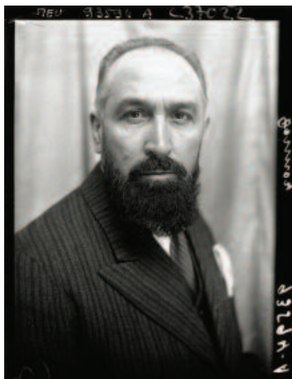
René Marx Dormoy, né le 1 er août 1888 à Montluçon.

ponsables de la défaite » et déplorent la mollesse du gouvernement à leur rencontre, l'ancien ministre, dénué de toute protection, constitue une cible d'autant plus facile que sa présence à Montélimar a été abondamment signalé dans la presse vichyste.