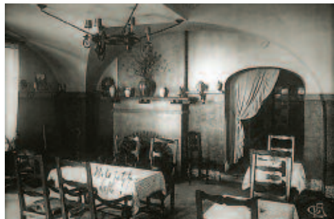
Le Relais de l'Empereur à Montélimar photographié dans les années 1930 (sa réception et sa salle à manger). Marx Dormoy résidait au 2 e étage.

l'assassinat de Mandel – écarter la piste allemande : sinon pourquoi un commando nazi aurait-il, en janvier 1943, libéré par la force, les assassins ?