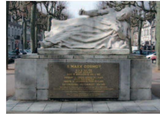
Montluçon (Allier). Le monument à la mémoire de Marx Dormoy évoque clairement l'attentat dont il fut la victime.

Le matin de ce même 29 juillet, Marx Dormoy est enterré à 7 h du matin au cimetière de Montélimar dans la plus stricte intimité , seules 10 personnes ont été autorisées à y assister par le ministère de l'Intérieur qui, par crainte de manifestations, a refusé le transfert du corps à Montluçon que souhaitait la famille.