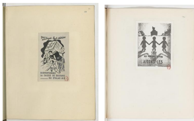
Documents conservés à la BNF (NAF 1728 et NAF 1781)

de la manifestation dont l'entrée payante visait à remplir la Caisse de solidarité à destination des enfants. Cela ne refroidit pas pour autant l'énergie créatrice des intéressés. De nombreux papillons informatifs circulent dans les camps. Afin d'assurer la communication sur les collectes d'argent, certains prisonniers mettent à disposition leurs talents de graphistes. Des affichettes sont ainsi distribuées au sein des camps ou publiées dans les journaux internes. 8 :